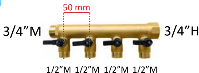
COLECTOR MODULAR MACHO-HEMBRA 3/4" CON VÁLVULAS DE ESFERA INCORPORADAS